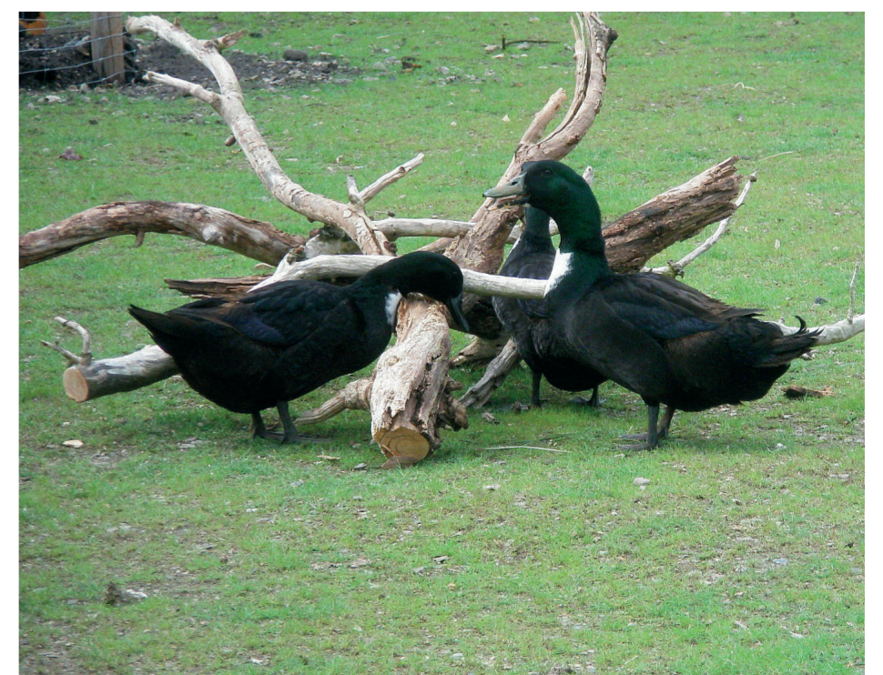
Ente (links) und Erpel (rechts) der Pommernente