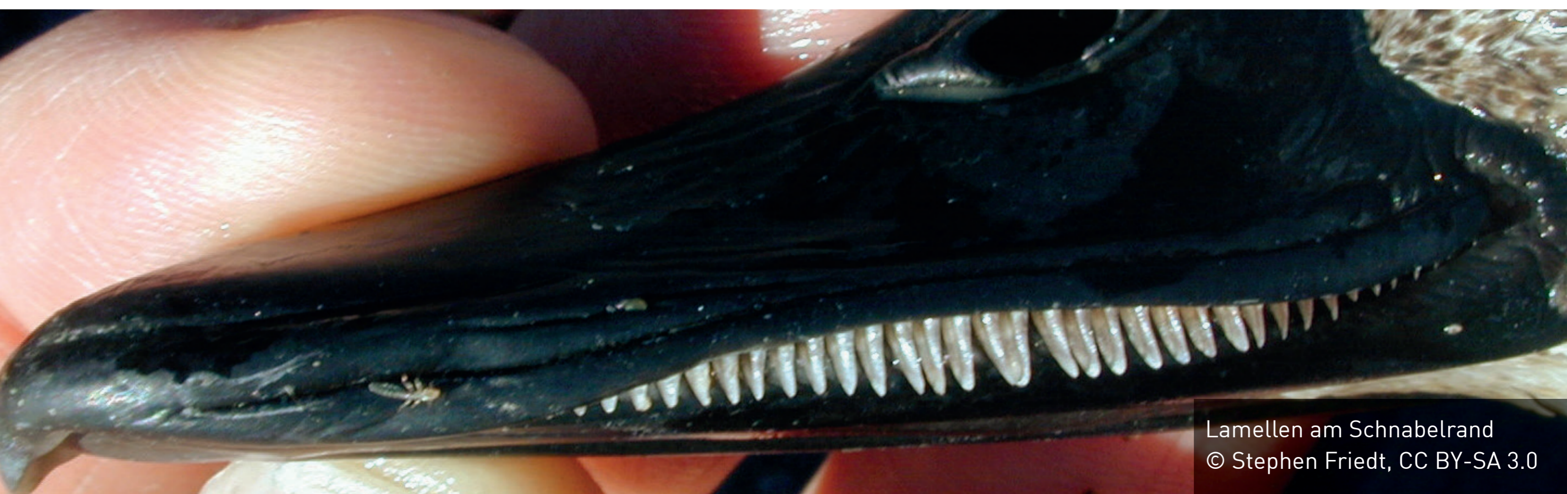
Lamellen am Schnabelrand