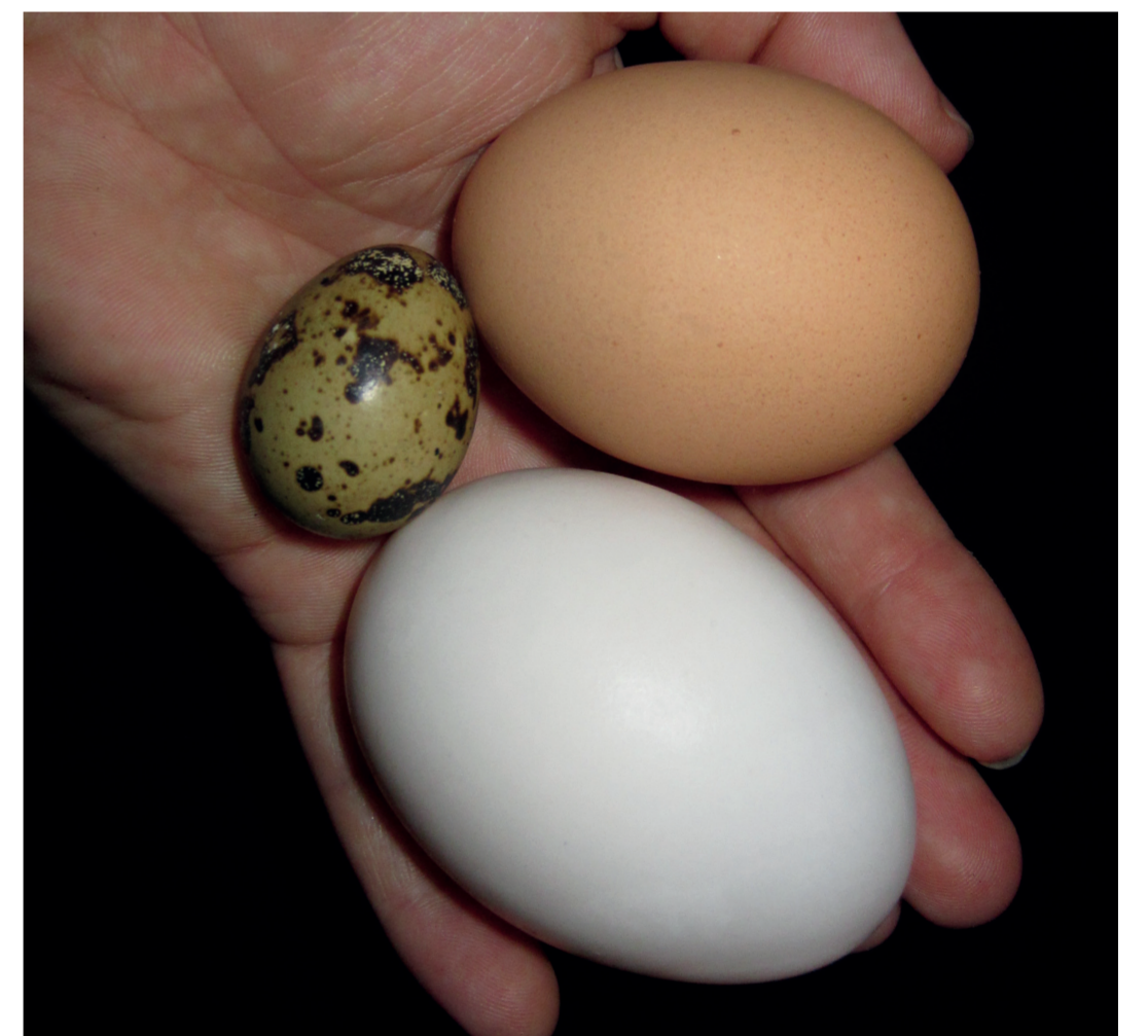
Größenvergleich zwischen Wachtel-, Hühner- (braun) und Entenei (weiß)